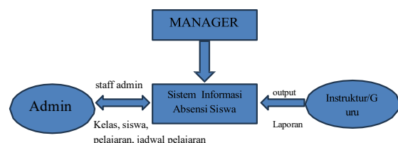
Gambar 1. Diagram Konteks

Diagram konteks adalah diagram yang terdiri dari suatu proses data menggambarkan ruang lingkup suatu sistem. Diagram konteks merupakan level tertinggi dari DPD yang menggambarkan seluruh input ke sistem atau output dari sistem. Berikut adalah diagram konteks dari sistem informasi