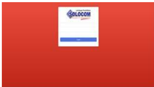
Gambar 3. Halaman Login Peserta